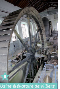
Usine élévatoire de Villiers