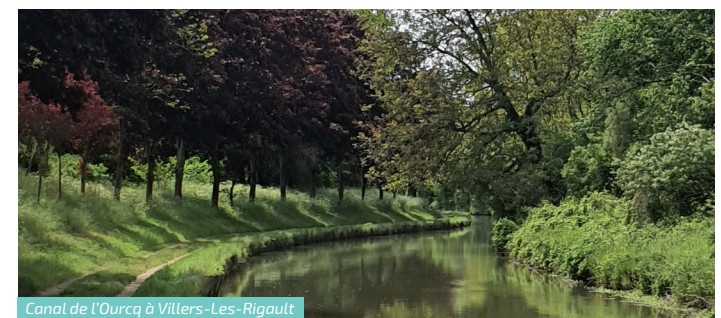
Canal de l'Ourcq à Villers-Les-Rigault