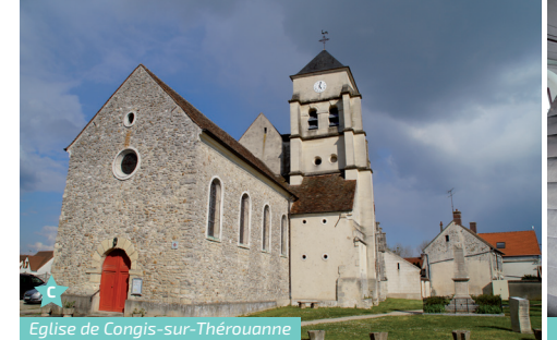
Eglise de Congis-sur-Thérouanne