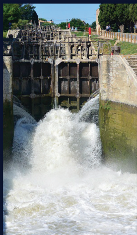
Le canal du midi - Les 9 écluses