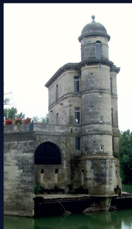
Le Moulin Cordier