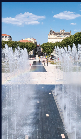
Place Jean Jaures