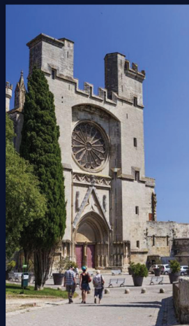
Cathédrale St Nazaire