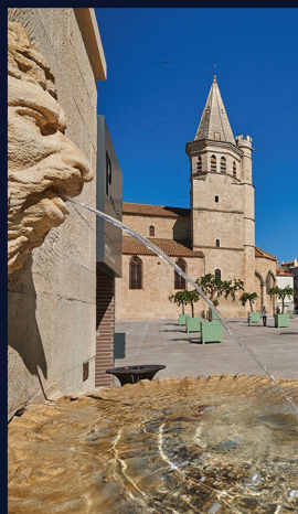
L'église de la Madeleine