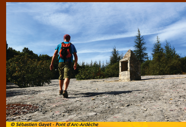
© Sébastien Gayet - Pont d'Arc-Ardèche

La Grande Lauze est une immense dalle calcaire correspondant à une strate résistante à l'érosion. Des gouffres s'ouvrent par endroit et des abris sous roche ont été anciennement utilisés comme bergerie. Le pendage (orientation d'un plan, d'une surface) de cette couche géologique a été mis à profit pour recueillir l'eau dans une superbe citerne au milieu de la grande lauze.