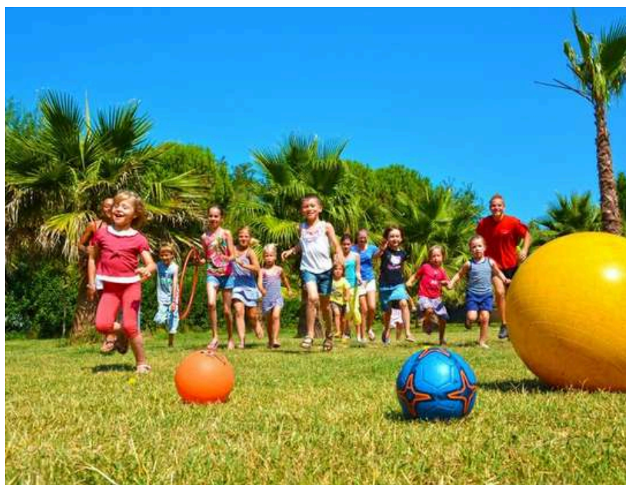
Club enfant & Club Ado en Juillet et Août