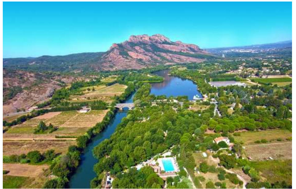
Le fleuve Argens