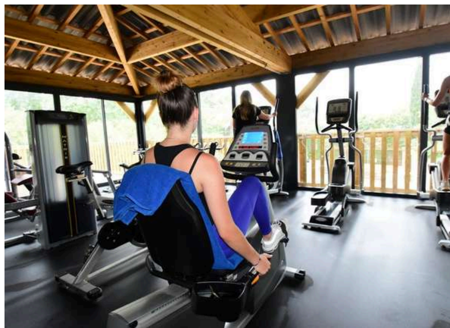
Salle de sport