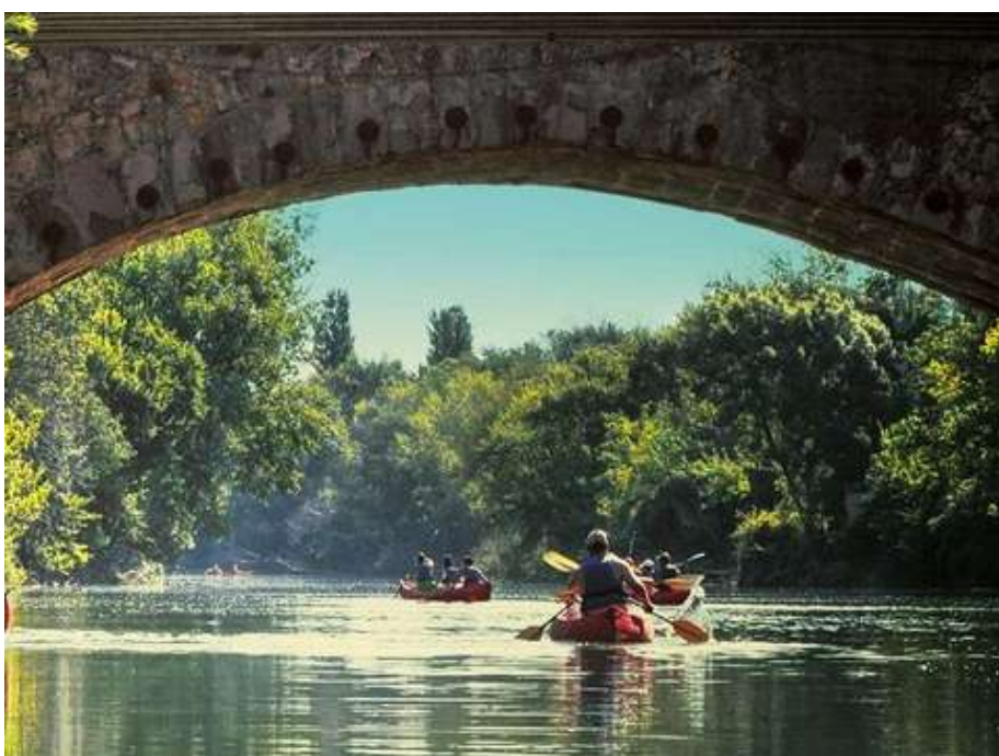
Canoé sur l'Argens