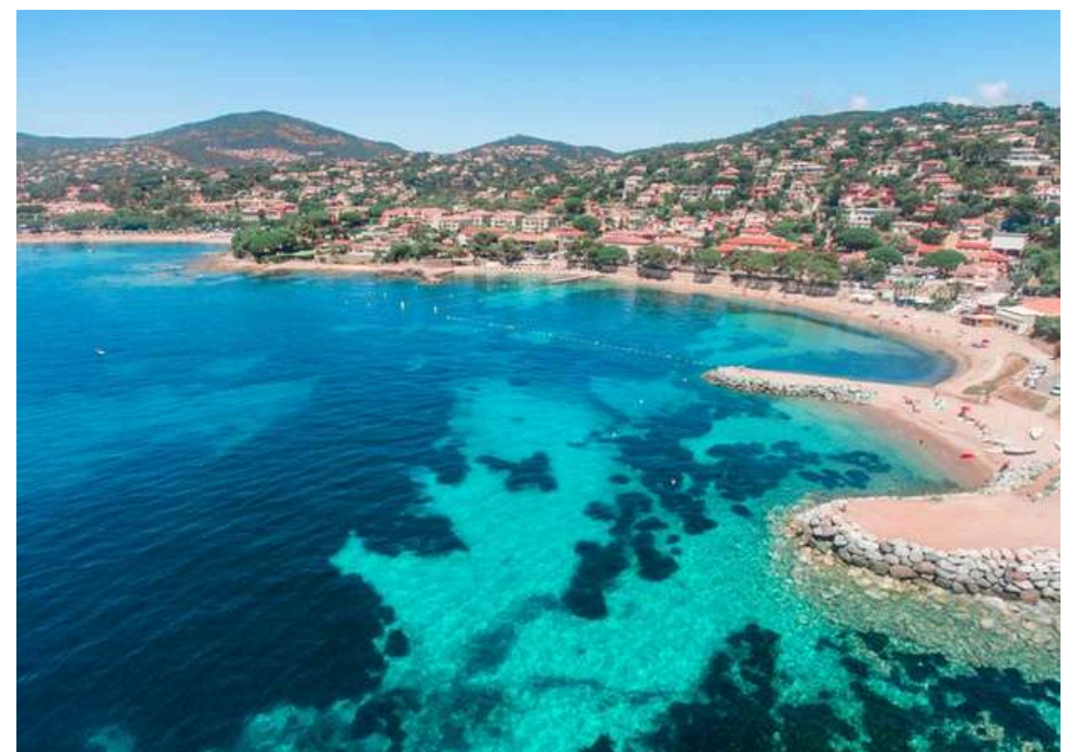
Plage des Issambres