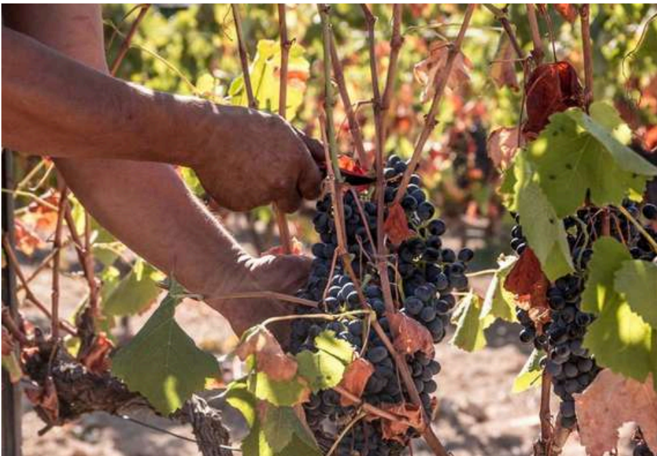
Découvrez nos vignerons