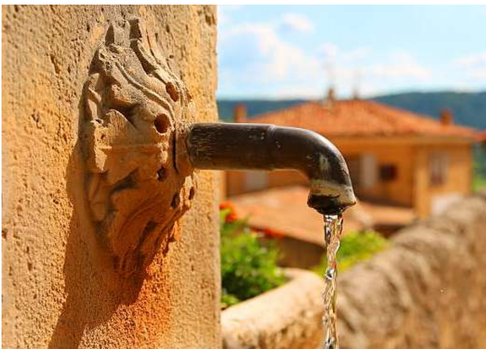
Découvrez les villages du Var