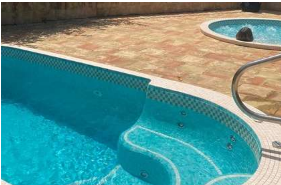
Jacuzzi de Nage