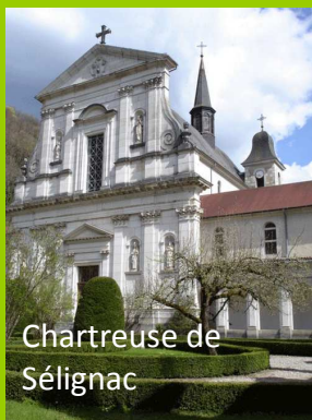
Chartreuse de Sélignac