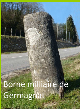
Borne milliaire de Germagnat