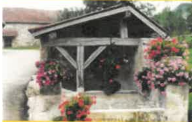
Lavoir du Villaret