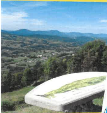
Belvédère de la Vierge