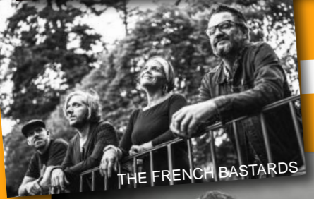
THE FRENCH BASTARDS