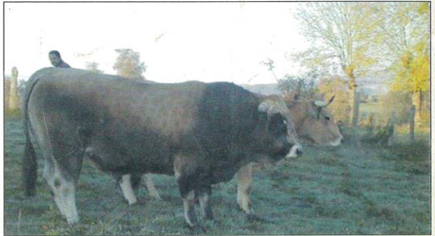
Beau taureau de la race Aubrac

Sur le circuit, près de la ferme de Cromières, vous pourrez admirer de superbes Aubrac pure race. N'oubliez pas qu'elles sont très maternelles et qu'en cas de dérangement (ex : des chiens), elles n'hésiteraient pas à foncer. Mais si vous les respectez, vous pourrez alors vous émerveiller devant leurs beaux yeux de velours !!!