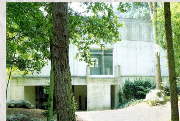
Nemours : entrée du musée de la préhistoire

Entre chaos rocheux et mer de sable, ce parcours, dans la forêt de Nemours, révèle des sites originaux comme la grotte Troglodyte et offre de larges panoramas sur les paysages alentours. Il requiert par endroits endurance et agilité.