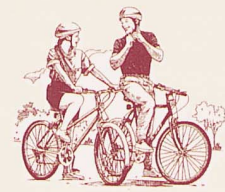
Liaison Fontainebleau-Barbizon à vélo Circuit balisé FB : 8 km / 1h15