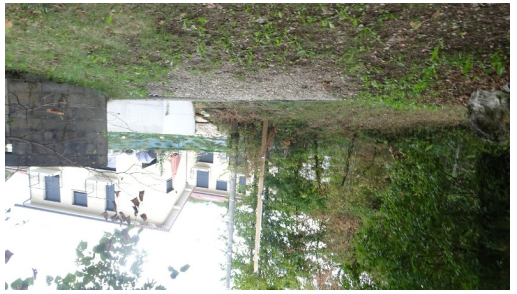
Crédit : Anne-Marie Barbe, Pays de Gex et sa Station Monts Jura suivre le chemin de Chasut (face au Jura)