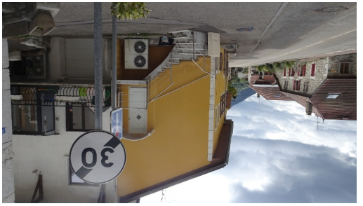
Au départ du centre du Village. (parking de l'église).

Chemini sur la droite. ict, le sentier rejoint la route, tourner à gauche et descendre jusqu'au virage : 1er