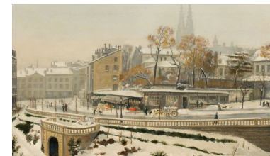
Vue du boulevard Desaix à Clermont-Ferrand - CAROT Jules © Clermont Auvergne Métropole, MARQ / Photo Florent Giffard

Durée : 3h. Sur réservation. Tarif : 5€.