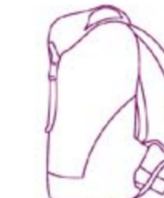
Sac à dos Back pack