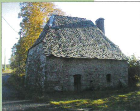
Four privé au village de Burquerette

Aucune difficulté, partie en forêt très agréable.