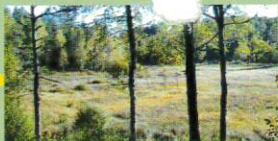
La tourbière des Mazes