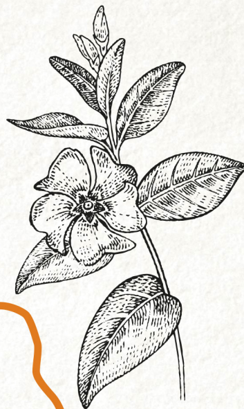
Pervenche « vinca ».