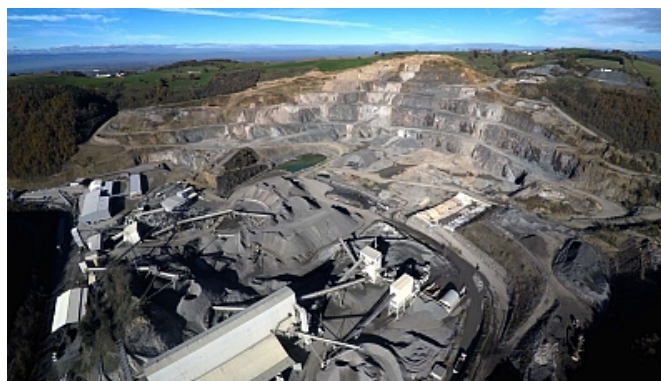
drone elec 2016

Carrière de granit ouverte en 1936 Tirs de mines, extraction de matériaux, cribles, taille de granulats, concasseurs, cette carrière produit du sable, des gravillons et du béton.