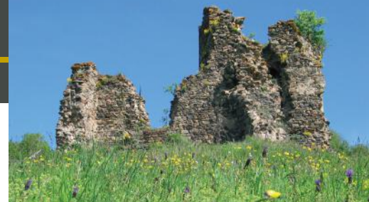
Les ruines du château de Montgon. -PG-

La fondation de l'une des plus anciennes abbayes bénédictines d'Auvergne attise la convoitise de puissantes familles seigneuriales. Les terres qui appartenaient au comte d'Auvergne sont fragmentées et accaparées par certains seigneurs. Les Mercœur vont se constituer de vastes domaines. Ils s'emparent des droits de justice à Blesle et de certains biens du monastère.