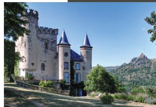
Au XVI e siècle, la tradition se maintient au château de Torsiac avec la construction d'une tour de plan quadrangulaire, fortement remaniée au XIX e siècle, avec un système de faux mâchicoulis. -PG-

Le château de Védrines impose une belle architecture du XIX e siècle dans un style néogothique, au même titre que le château de Torsiac. Celui-ci, situé face à Léotoing, surplombe l'Alagnon de quelques mètres. Ce site a été occupé dès le Moyen Âge et réaménagé au cours des siècles. Le donjon du XIV e siècle a été complété au XIX e siècle de faux mâchicoulis, lui conférant un style dit « troubadour ». Le corps de logis rectangulaire, sans doute construit à la Renaissance, a bénéficié d'importants travaux de réaménagements au XIX e siècle avec l'architecte clermontois, Poinson.