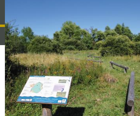
Sentier de découverte autour du lac de Lorlanges.

A ujourd'hui le lac est classé en ENS (Espace Naturel Sensible) et zone Natura 2000 afin de protéger cet espace.