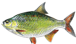
2 Le rotengle

découverte de la pêche. N'hésitez pas à observer les indices de leur présence pour choisir votre lieu de pêche.