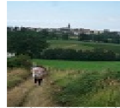
Légende : Circuit V : Petit Tour de St Martin

Balisage : lettre du circuit sur fond bleu. Départ place du Plon. Ce parcours fait le tour du village sur sa partie ouest. Il longe le Pontensinet entre 2 vieux moulins. Plus haut, vous franchir la voie du Tacot (ancienne voie ferrée).