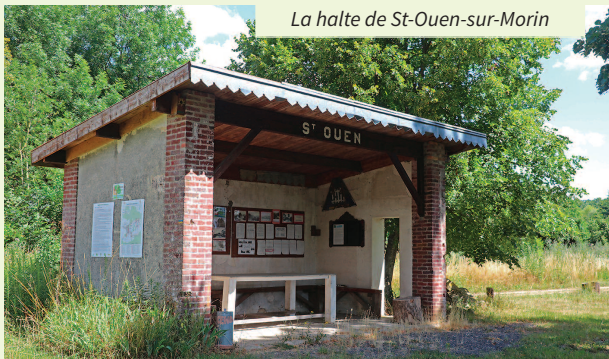
La halte de St-Ouen-sur-Morin

Elle était concédée à la compagnie de chemins de fer départementaux (CFD) et reliait ces deux villes par la vallée du Petit Morin de son ouverture en 1889, à sa fermeture en 1947.