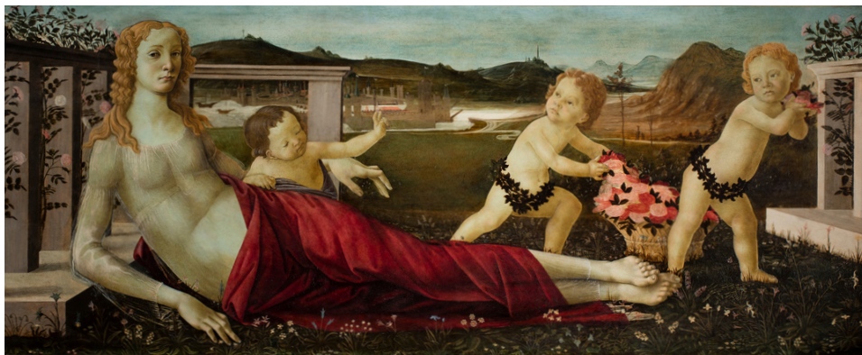
Sandro Botticelli , Vénus aux trois putti Dépôt du musée du Louvre

Notre médiatrice vous attend dans le cloître du musée et vous propose un instant à part: se poser, échanger, imaginer, et créer un souvenir à emporter de votre visite!