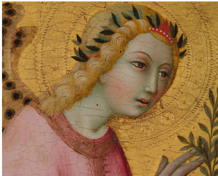
Sano di Pietro, Ange d'Annonciation (détail) Dépôt du musée du Louvre

Réservation possible au 04 90 86 44 58 ou museepetitpalais@mairie-avignon.com (jusqu'au vendredi)