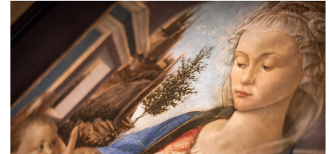
Sandro Botticelli, La Vierge et l'Enfant . Dépôt du musée du Louvre