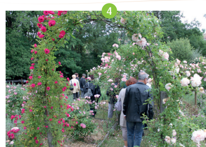
Jardin des plantes à couleurs - Le Bourg