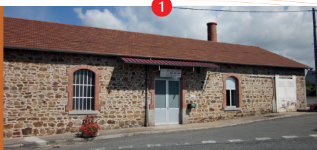
Ancienne usine Fayard

Visite du jardin des plantes à couleurs Etang de la Tuilerie