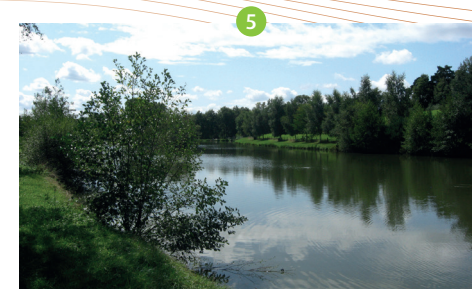
Etang de la Tuilerie