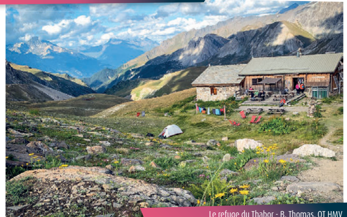
Le refuge du Thabor

Allez! Encore un effort, le Lac Rond puis le Lac Long se dévoilent pas après pas. Reconnaissez-vous les Rois Mages qui se dressent fièrement dans votre dos? Balthazar, Melchior et Gaspard sont les maîtres des lieux.