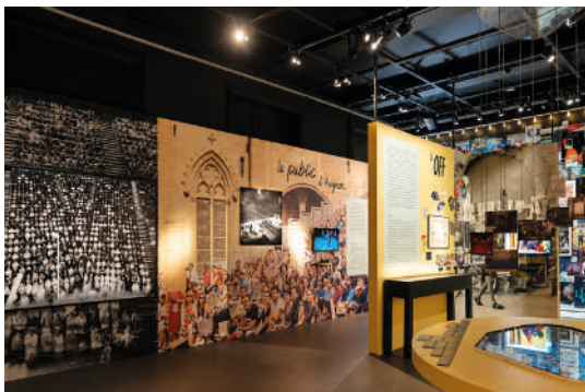
Vues d'exposition Les Clés du Festival