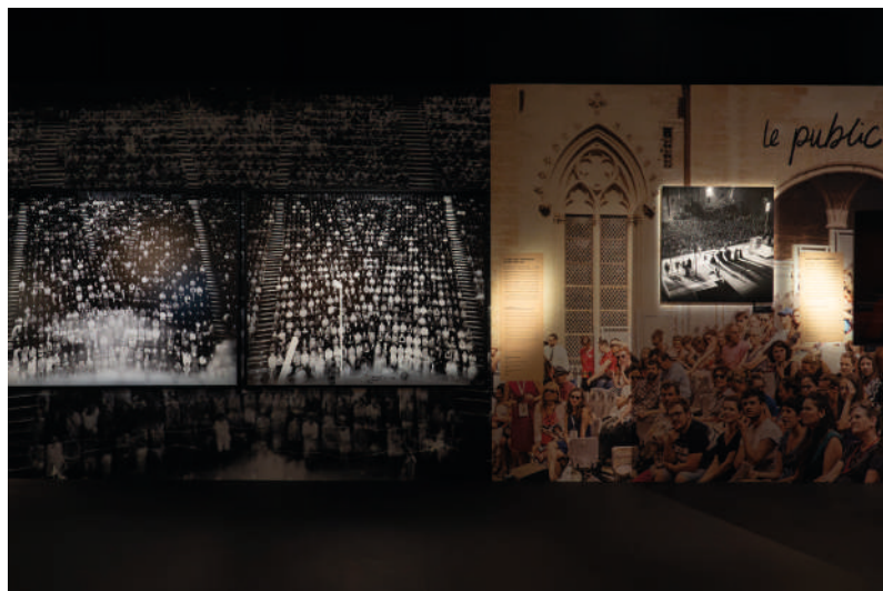
Vues d'exposition Les Clés du Festival

Frédéric sera avec nous, le temps du Festival, avec un grand tirage d'une de ses photographies sur le mur de calade.