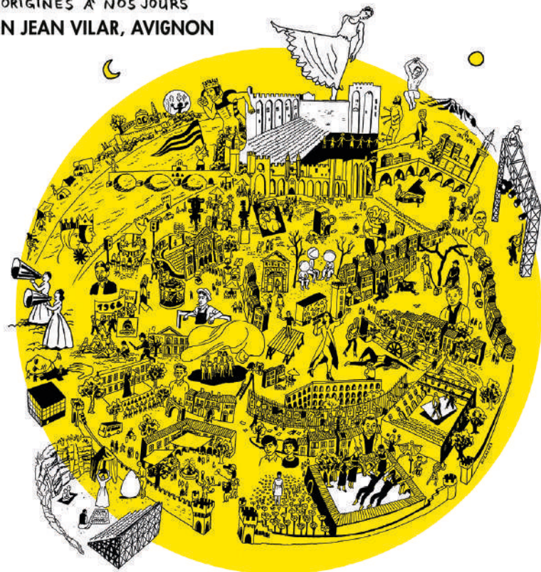
Illustration © François Ollislaeger

L'AVENTURE DU FESTIVAL D'AVIGNON DES ORIGINES À NOS JOURS MAISON JEAN VILAR, AVIGNON