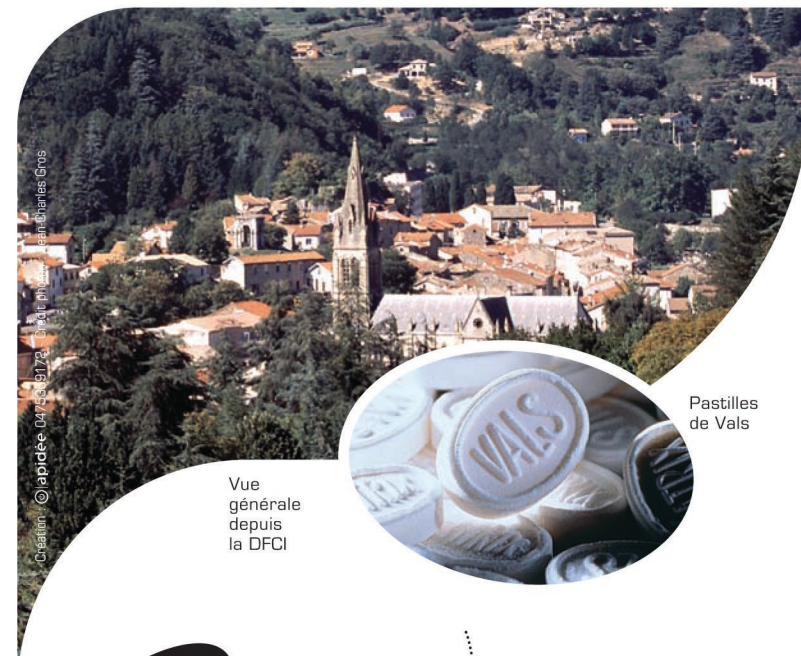
Pastilles de Vals

Prenez la rue Paul Ribeyre à droite et longez les thermes sur votre droite. Continuez à traverser le quartier thermal : peu avant la fin de l'avenue, le kiosque Saint-Jean, ouvert l'été, vous permet de goûter l'eau de source. En face, de l'autre côté de la rue, la Société des Eaux Minérales produit l'eau de Vals. Empruntez le pont Saint-Jean sur votre gauche pour rejoindre la Place Charles-de-Gaulle puis remontez la rue Jean Jaurès jusqu'au panneau Info Rando.