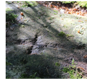
Le pont de l'Ours sur le ruisseau de Malgoutte.

4 Prendre la route à gauche, passer devant le petit Pont de l'Ours et retrouver la route départementale. La longer sur la droite. Prendre la 1 ère route à droite, qui vous mène à Malgoutte. Quitter le goudron et monter sur le large chemin qui longe une allée de hêtres tortueux et la prairie humide de Malgoutte.