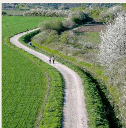
La Rigole Domaniale ou des Granges

aqueducs, la Région a décidé d'effectuer d'importants travaux de restauration, d'une part pour maintenir le rôle clé de ce réseau qui assure une agriculture florissante sur le Plateau de Saclay et permet la biodiversité, tout en luttant contre les inondations grâce à un système moderne de régulation, et d'autre part pour réalimenter les fontaines de Versailles.