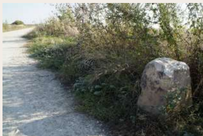
Borne fleurdelysée sur la Rigole Domaniale

Ce circuit est situé non seulement dans le site classé depuis juillet 2000 de la Vallée de la Bièvre, ensemble naturel le plus proche de la capitale, mais aussi dans la Zone de Protection Naturelle, Agricole et Forestière (ZPNAF). Ce dispositif législatif, datant de la loi du Grand Paris de 2010 et unique en France, préserve de l'urbanisation 4 115 ha dont 60 % sont constitués d'exploitations agricoles.