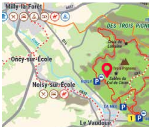
Chemin de la Plaine de Jean des Vignes, Forêt des Trois Pignons - Noisy-sur-école