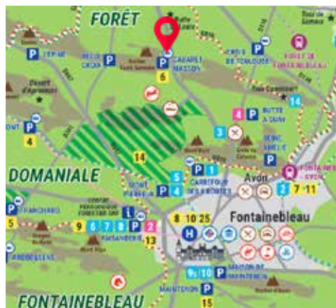
Au parking du Cabaret Masson, Fontainebleau