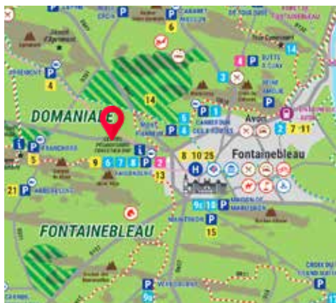
Au Centre Pédagogique Forestier, Fontainebleau