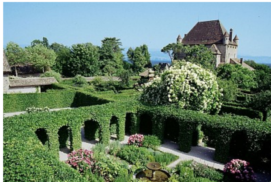
Le Labyrinthe Jardin des Cinq