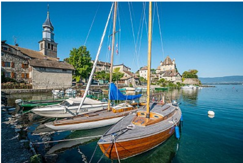
Destination Léman / Antoine Berger

Plaisanciers et pêcheurs de métiers se partagent les appontements situés en dessous de l'église où le Port des pêcheurs constitue comme une bulle hors du temps un coin calme et paisible, fréquenté par la faune locale.