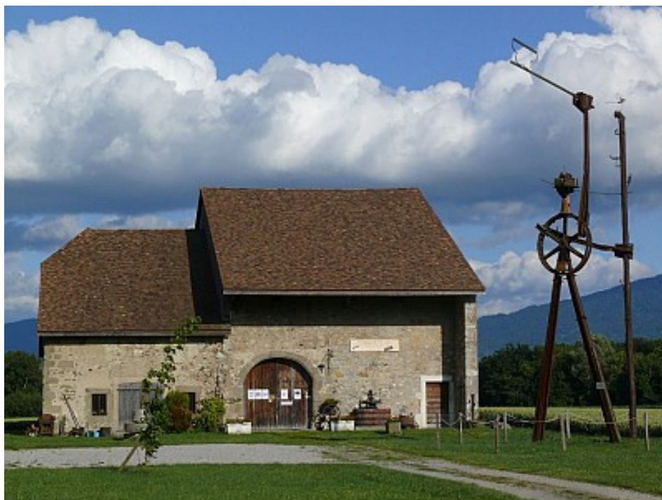
Art et Culture

Les Granges de Servette abritent une collection permanente d'art contemporain et d'outils anciens dans une grange caractéristique de l'architecture savoyarde s'enrichissant, chaque saison, d'expositions temporaires destinées à faire connaître de jeunes artistes. Parcours ludique pour les enfants.