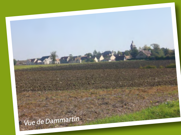
Vue de Dammartin