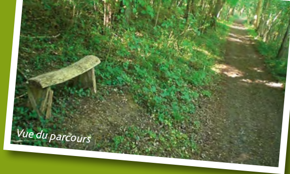
Vue du parcours