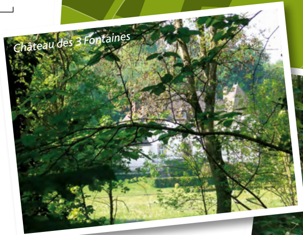
Château des 3 Fontaines