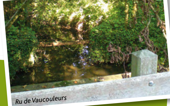
Ru de Vaucouleurs