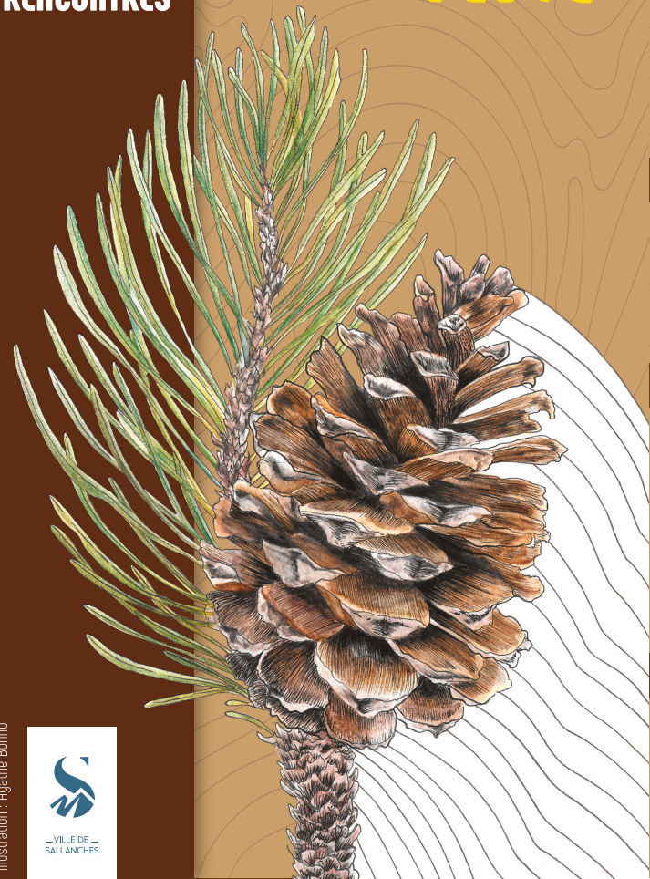
Illustration : Agathe Borno