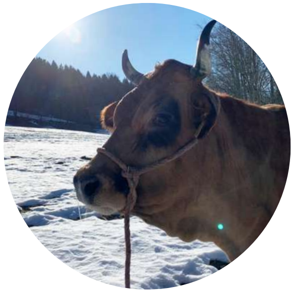
Loustic du GAEC la Ferme de Fouda Blanc

En tant que Président de l'association des propriétaires de la Haute Vallée du Guiers Vif, vous le croiserez sans doute lors de votre visite. Engagée dans la préservation du site, son entretien, sa valorisation et la bonne entente avec les visiteurs, l'association constitue un pilier du Cirque et œuvre activement toute l'année à ses missions.