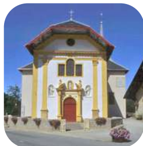
Eglise de Saint-Nicolas de Véroce