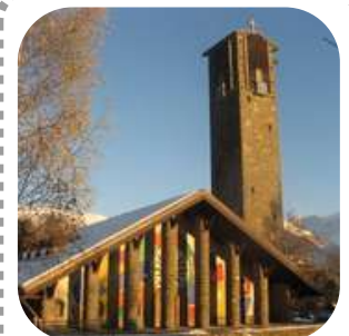
Eglise Notre-Dame de Toute Grâce au plateau d'Assy