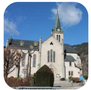
Eglise Sainte-Marie-Madeleine à Praz-sur-Arly