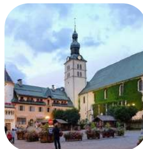
Eglise Saint Jean-Baptiste à Megève