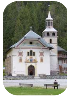
Eglise Notre-Dame-de-la-Gorge Les Contamines-Montjoie

La Haute-Savoie possède un patrimoine religieux exceptionnel, notamment baroque. Il s'est épanoui dans les églises paroissiales, comme dans les plus petites chapelles de montagne. Cet essor du baroque alpin révèle la profusion de l'or et des couleurs, dans cet art nouveau chargé de préfigurer la beauté du paradis. D'autres surprises vous attendent dans un tout autre style architectural à Praz-sur-Arly et au Plateau d'Assy.