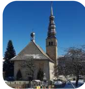
Eglise Saint-Nicolas à Combloux