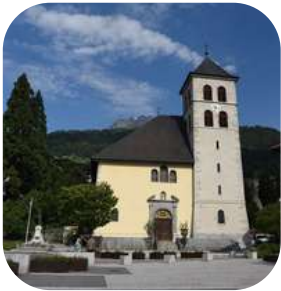
Collégiale Saint-Jacques à Sallanches