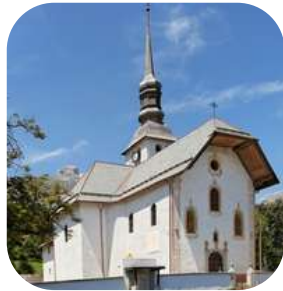
Eglise Notre-Dame de l'Assomption à Gordon