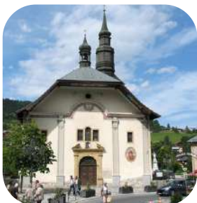
Eglise de Saint-Gervais les Bains