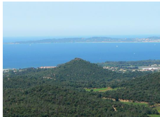
Le Pic St Martin au centre, site d'un des oppida.

Dès le XI ème siècle, toute la partie du territoire hyérois située sur la rive gauche du Gapeau et des salines en limite de Bormes s'appelait Bormetta , puis Bormette ou Bro(u)mette , enfin Les Bormettes . Ce vocable proviendrait de Bormani , nom d'une tribu celto-ligure qui occupait un territoire beaucoup plus vaste que le quartier actuel, délimité par les communes de Bormes à l'est, de La Garde à l'ouest, de Pignans au nord. Des vestiges d'oppida, habitats fortifiés de hauteurs permettant de surveiller, protéger et défendre un si vaste territoire, pourraient attester de la présence de ce peuple sur la commune.