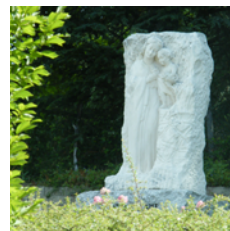
La Madone 10

Empruntez le chemin des Plats (à droite), suivi du chemin de la Madone sur votre gauche. Ne prenez pas l'impasse. Au prochain « cédez le passage », vous verrez une Madone 10 sur la droite.