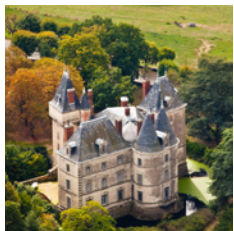
Le château 3

En face de l'église, se situe une 1 ère croix 2 en granit où est inscrit « Aimez-vous comme je vous ai aimés - 1948 ».