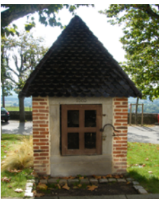
Le puits 4

À ce carrefour, on distingue un puits 4 avec une toiture en tuiles plates de type écaille en terre cuite . Datant de 1885, il possède une manivelle, une poulie, des seaux et... a toujours de l'eau !