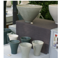
Foire à la poterie

En honneur de ce passé, une foire à la poterie a été créée en 1986. Elle se tient chaque année pour la fête des mères sur l'allée des Tilleuls et réunit une cinquantaine de potiers.