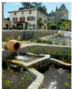
Vivier à poissons

Dans une salle du donjon (tour carrée face au bourg), des peintures du XVI e siècle ornent le plafond. Elles racontent l'épopée de Jason et la Toison d'or.