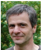
Patrice LIRON Sculpteur - Bordeaux

Une installation de deux loups blancs en bois