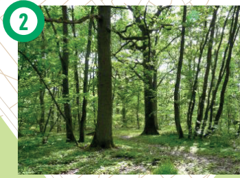
2 Forêt de Sénart Au IXème siècle, la forêt de Sénart faisait partie de l'arc boisé qui reliait le bois de Vincennes à la forêt de Fontainebleau. Intégrée au domaine royal en 1314, la forêt fut aménagée pour la chasse au cerf et au loup. Ces grandes allées dessinées pour les chasses royales sont toujours accessibles. A la Révolution, la forêt devint propriété de l'État. Chênes, charmes, châtaigniers, bouleaux et pins sylvestres composent la flore de ce territoire verdoyant. Arrêtez-vous notamment au carrefour des Quatre chênes pour y admirer le chêne sessile qui, à 500 ans est le doyen de la forêt. Vous passerez à la Faisanderie construite sous Louis XVI, qui héberge aujourd'hui le Centre d'information à la forêt dédié au public scolaire.