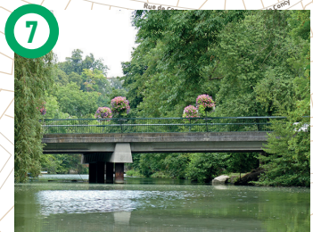
7 Pont de Soweto, Yverres Entre les clapotis de l'eau et le plongeon des canards, le cadre est idéal pour une balade bucolique le long de la rivière.