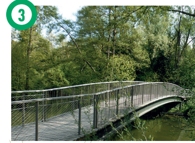
3 Bords de l'Yverres, Bussy-Saint-Antoine Parc, sentier, passerelle et vieux pont se trouveront sur votre chemin.