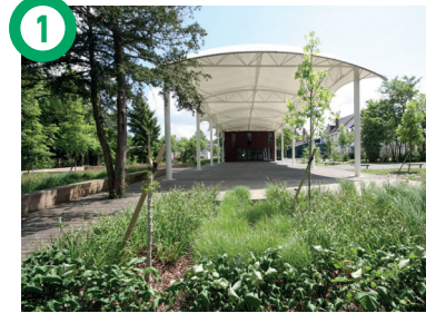
1 Maison Verte, rue de Combs-la-Ville, Quincy-sous-Sénart La Maison Verte est dédiée aux expositions et à la sensibilisation du public aux questions de l'environnement. Son parc inclut un ancien boisement dont les essences végétales sont mises en valeur.

DÉPART Maison Verte (Quincy-sous-Sénart)