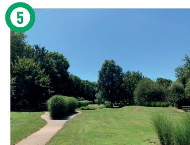
5 Ile de Brunoy, Brunoy L'île a été entièrement aménagée en parc de promenade avec aire de jeu pour enfants, boudodrome, équipements légers de loisirs. Elle se termine à l'est par le barrage dit des Vannes rouges.