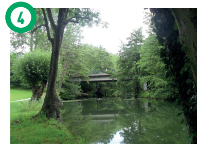
4 Bords de l'Yverres, Epinay-sous-Sénart Passerelle, lavoir, viaduc et ancien moulin à huile ponctuent cette partie du cheminement des bords de l'Yverres.