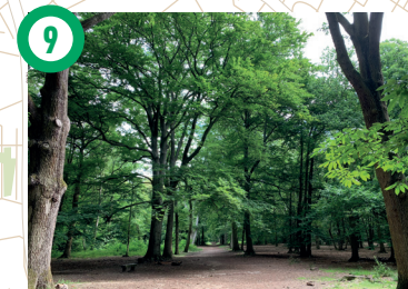
9 Forêt de la Grange, Crosne, Yverres Cette forêt est issue du regroupement de plusieurs entités boisées. Elle comprend la petite forêt des Camaldules, plusieurs espaces forestiers situés sur les communes de Limeil-Brevannes, Villecresnes et Yverres, l'ancienne forêt communale d'Yverres, et quelques acquisitions plus récentes comme celle du Petit Wirttemberg. Encadrée par deux châteaux, Gros Bois et La Grange, elle abrite de belles allées forestières composées principalement de châtaigniers, mais aussi d'autres feuillus, du chêne en particulier. Depuis l'allée du Grand Haha ou du Général Lejeune, vous apercevrez au loin l'élégant château de la Grange, rebaptisé château du Maréchal de Saxe. Par l'allée Royale, partez à l'ascension du Mont Griffon (115 m d'altitude). A la clé, un joli point de vue sur la vallée de l'Yverres et le sud de Paris.