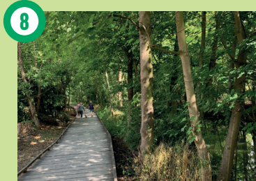
8 Bords de l'Yverres, Crosne Sur la promenade de Senlis, goûtez la fraîcheur des bords de l'Yverres entre moulin et parc.