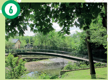
6 Parc des Deux Rivières, Yverres Il se situe à l'emplacement de l'ancien moulin de l'abbaye, à la confluence de l'Yverres et du Réveillon.