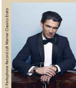
Gautier Capuçon, violoncelle

Moments privilégiés de transmission auprès de jeunes artistes, les « classes de maîtres » sont une occasion unique pour le grand public de découvrir les multiples facettes du métier de musicien interprète.