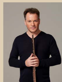
Emmanuel Pahud, flûte traversière