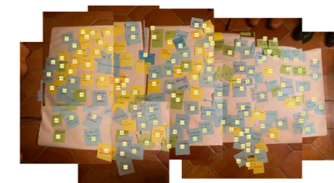
Représentation des méthodologies collectives de l'école du feu

NB : Création en cours - ces pièces ne seront pas forcément présentes sur l'exposition