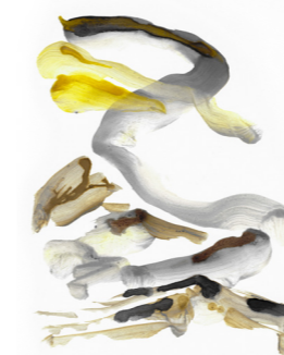
Encres de cendres, Garance Maurer