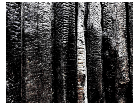
Les heures chaudes, Alain Arraez

📍 La Villa Mistral | Entrée libre | Visionnage et échanges autour des témoignages filmés avec les initiateurs de la démarche les 3 et 4 juillet (toute la journée) et les 8, 9, 10, 11 juillet (après-midi).