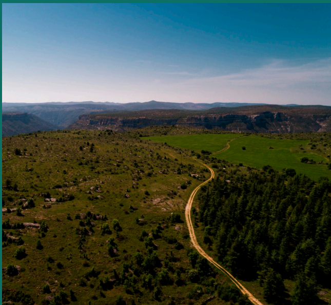
Causse de Blandas

LE VIGAN - MONTDARDIER - ROGUES - MADIÈRES ST LAURENT - ROQUEDUR - LE VIGAN