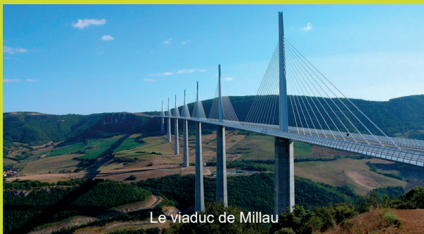
Le viaduc de Millau

Bus connection with Albi (29km), famous for its brick cathedral and the Toulouse-Lautrec museum