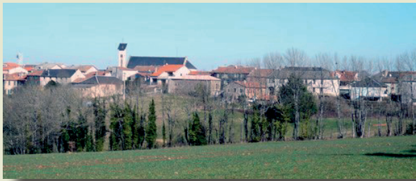
ALBAN - TARN (81)