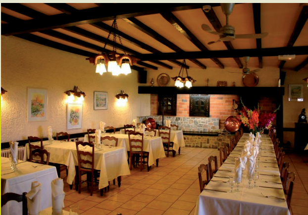
Salle de réception 120 couverts Conference and reception facilities