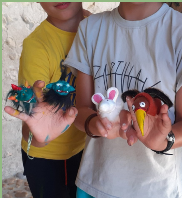
MARIONNETTE À DOIGT