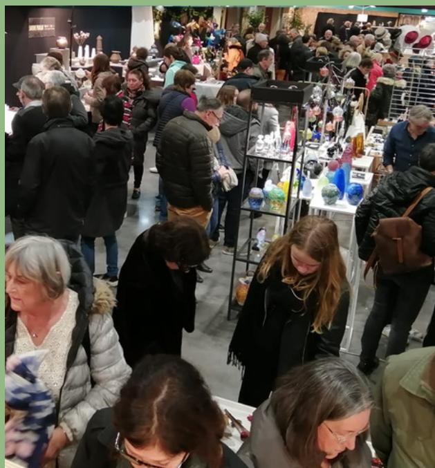
SALON PARTAGE A ANGOULEME