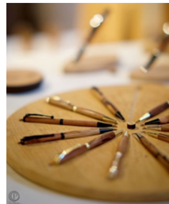
UN ARBRE DEUX VIES