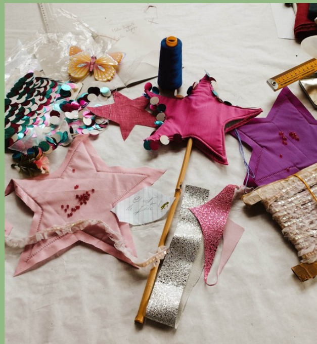
ATELIER BAGUETTE MAGIQUE