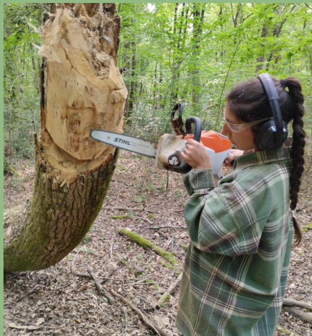
SCULPTURE SUR BOIS