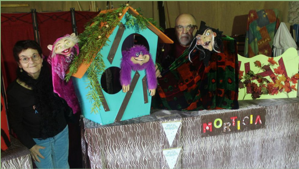
LA PETITE SORCIERE