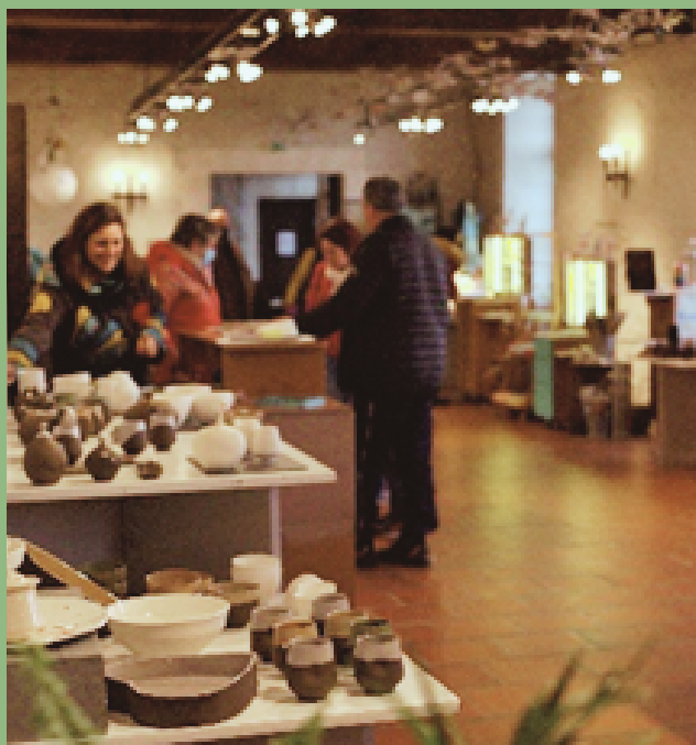
EXPOSITION AU CLOITRE DE CHALAIS