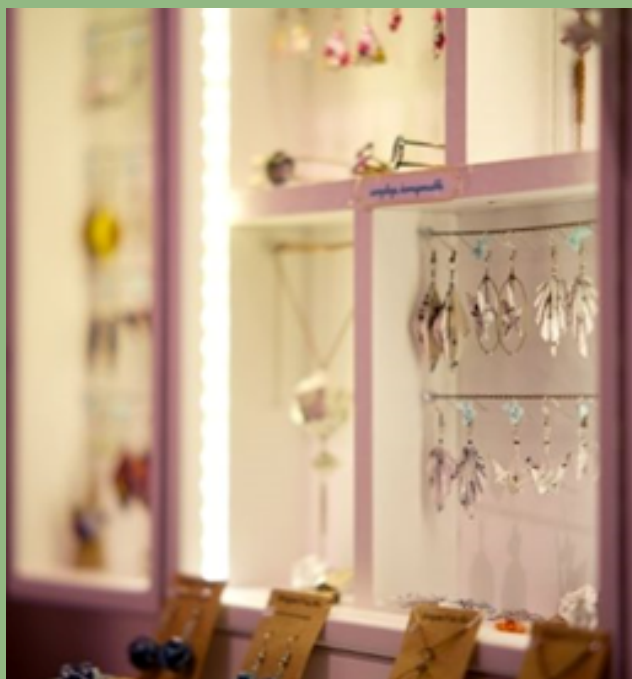
MARIGAMI P'TITS PLIS