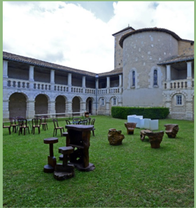
COEUR DU CLOITRE