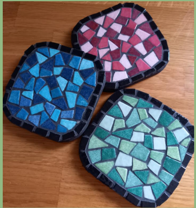
SOUS-VERRE EN EMAUX DE BRIARE