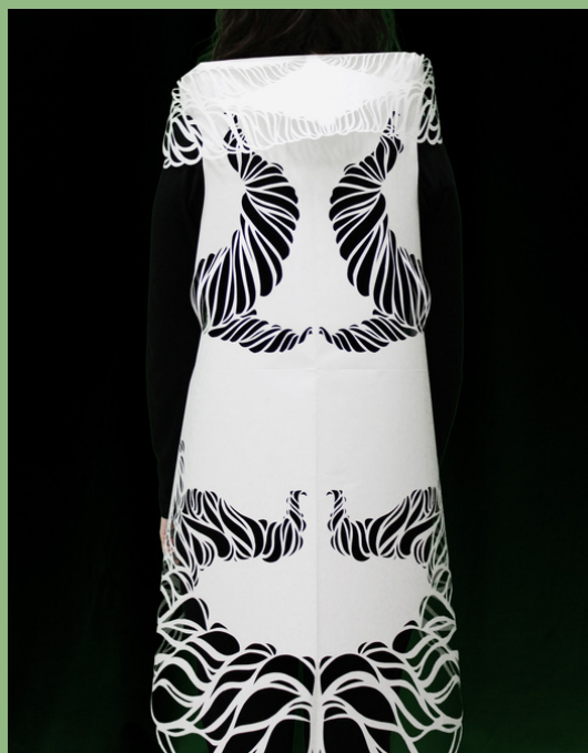
DENTELLE DE PAPIER