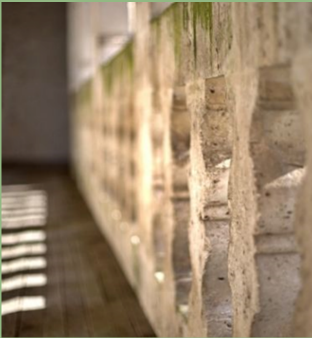
COURSIVE A L'ETAGE