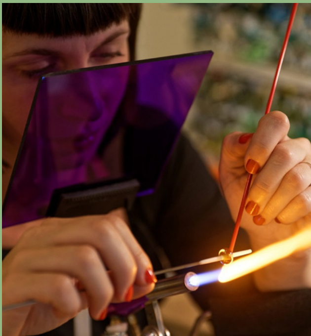
PERLE DE VERRE FILÉ AU CHALUMEAU