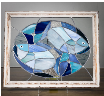
VITRAIL POISSON, MARYSE VITRAIL

Nous proposons cette année encore des démonstrations de savoir-faire, une exposition à thème "AQUATIQUE", des ateliers d'initiation, un historique du cloître, et des spectacles de marionnettes.