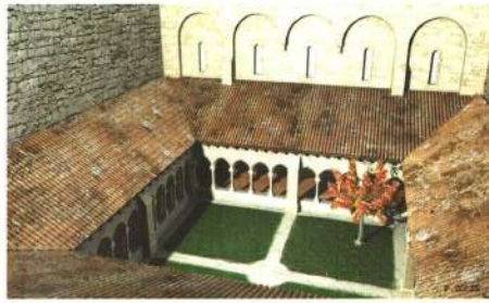
Reconstitution numérique du Cloître