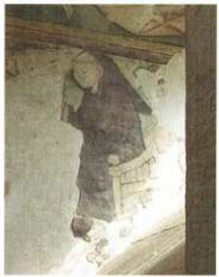
Peintures murales du XIII e siècle classées monument historique

Elle devient Prieuré dépendant de l'Abbaye de Cluny et rayonne sur plusieurs Prieurés et Églises en Périgord.