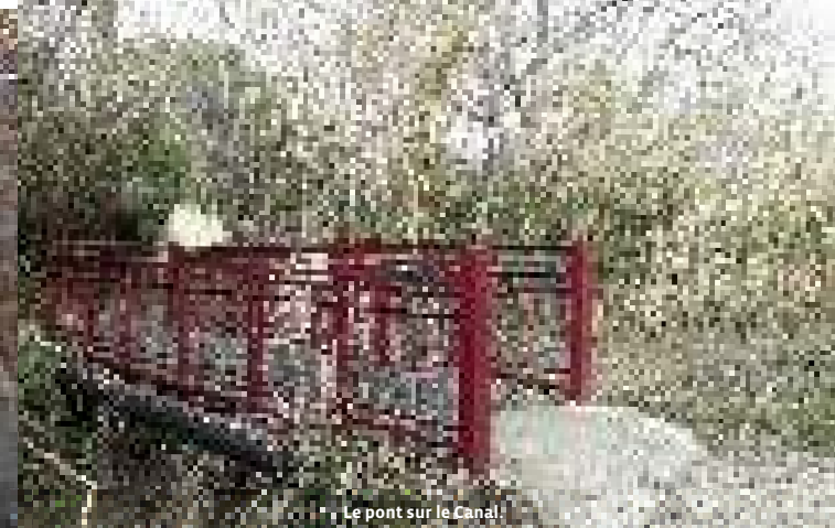
Le pont sur le Canal.

Balilage : Petits panneauaux de bois portant l'inscription QVG, peinte à la peinture rouge. Ref carte IGN : TOP25 3040ET : Carpentras / Vaison-la-Romaine / Dentelles de Montmirail