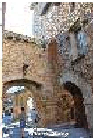
La Tour de l'Horloge.