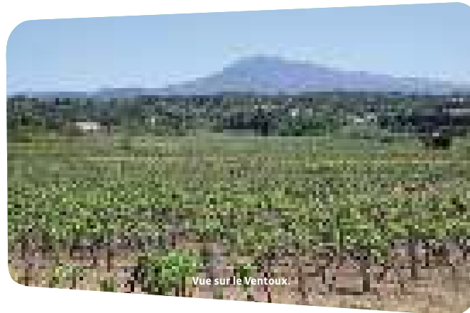
Vue sur le Ventoux.