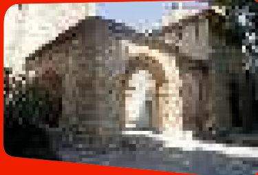
La chapelle Saint-Sixte.

La chapelle Saint-Sixte , édifice roman mentionné dès le 11 e siècle. Cet ancien monastère restauré abrite aujourd'hui un caveau de dégustation de vins au cœur d'un domaine de 64 ha.