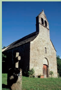
La chapelle de Vendes

La mise en eau du barrage de Bortles-Orgues noya une section de la ligne, n'assurant plus alors qu'une desserte locale ; elle fut définitivement fermée le 3 juillet 1994.