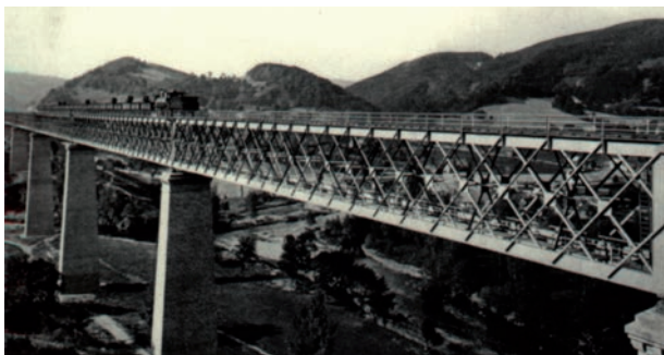
Test de résistance, phototypie de 1893

Peindre cet édifice n'est pas une mince affaire, pour couvrir les 15 000 m 2 de la structure il faut environ 12 tonnes de peinture.