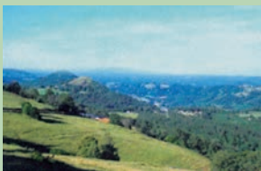
Vue depuis le hameau du Mas

Une randonnée qui, de Vendes et son impressionnant viaduc, vous conduit au sommet du Puy du Mas. Des pentes parfois un peu rudes mais le plus souvent à l'ombre des chênes.