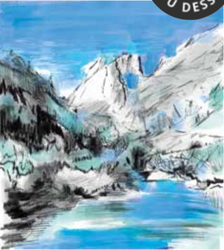
© Isabelle Vouigny, Vallée du Trient.

« Croquis passion : osez le trait ! » (dès 12 ans) avec Isabelle Vouigny, artiste plasticienne. Un parcours mêlant visite commentée et atelier créatif pour découvrir les étapes du dessin, du croquis préparatoire au geste final. La visite met en lumière le rôle du trait et l'importance du regard dans la construction d'une image.