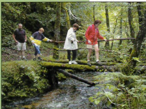
Petit pont sur le Remontalou

De nos jours, il ne reste plus que les vestiges de l'ancienne cheminée et quelques entrées de galeries dans lesquelles il serait très dangereux de s'aventurer, ce qui est d'ailleurs formellement interdit.