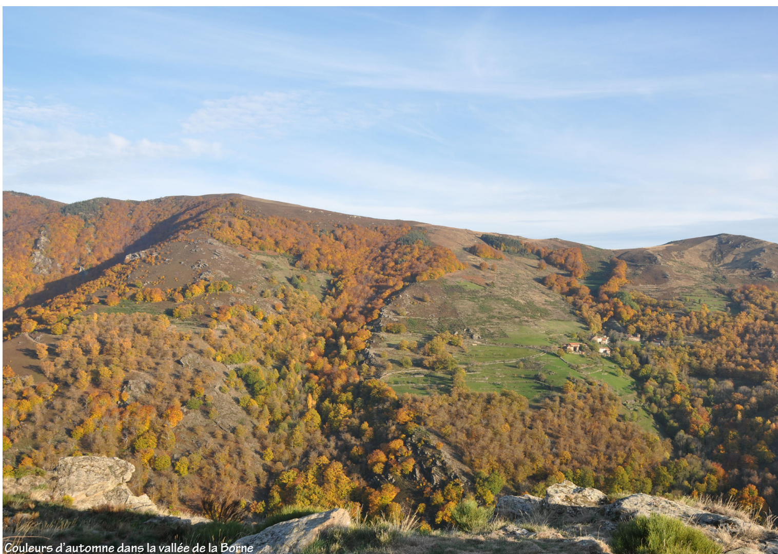
Couleurs d'automne dans la vallée de la Borne