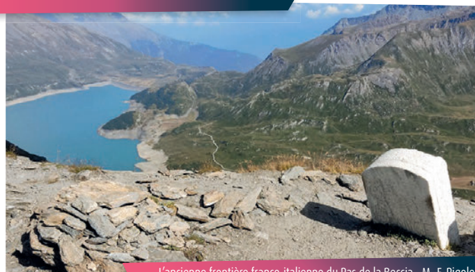
L'ancienne frontière franco-italienne du Pas de la Beccia - M.-F. Rigolet

Sur votre chemin, une halte gourmande à la ferme de La Vachère pourra faire oublier la monotonie du dernier kilomètre. Pour reprendre des forces, vous pourriez peut-être savourer le lait tout juste tiré de la dernière traite.